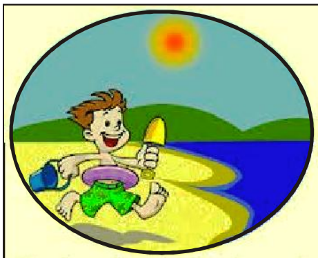
He is going to the beach

Futuro Imediato (Immediate Future), é usado para indicar uma ação que vai ocorrer muito em breve. É caracterizado pela presença do “going to”, em sua estrutura.